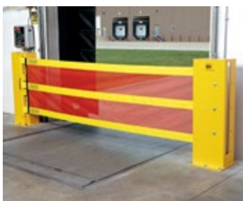
Rite-Hite Dok-Guardian säkerhetsbarriär