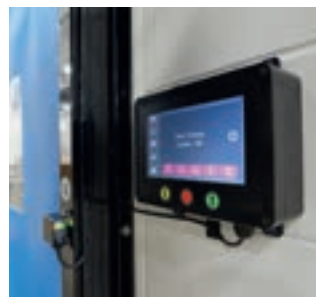
Grafiskt användargränssnitt (GUI)