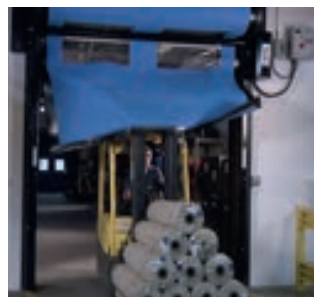
True Auto Refeed