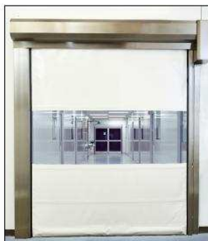
Idealisk för rena miljöer.