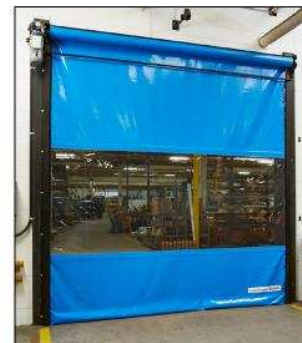
Tillval större fönster fält.