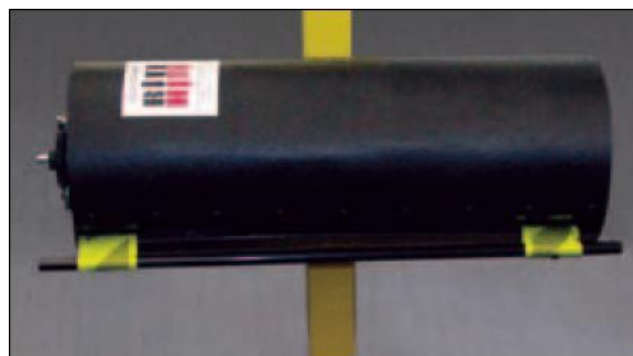
Trumman roteras I 90 grader vid återställning