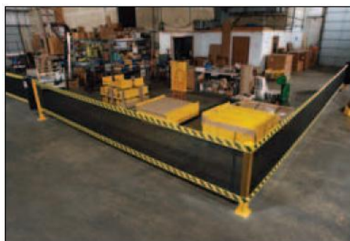
Kan byggas i flera olika varianter med extra hörnstolpar