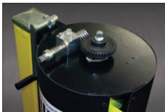
Svart ABS förvarings trumma med 20:1 utväxling för enkel uppspanning.