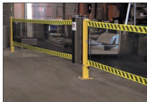
För större avstånd bygg i hop 2st Spanguards med en gemensam stolpe.